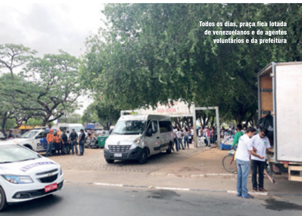
Todos os dias, praça fica lotada de venezuelanos e de agentes voluntários e da prefeitura