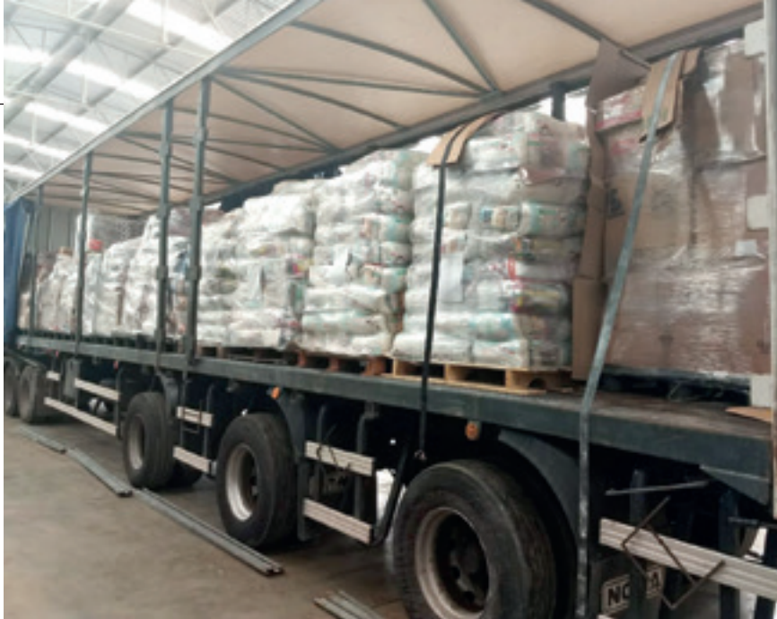
Foi preciso usar uma carreta para transportar todo o material arrecadado