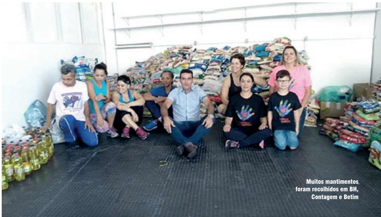
Muitos mantimentos foram recolhidos em BH, Contagem e Betim

tem que ser feita, e estamos à disposição para continuar a colaborar”.