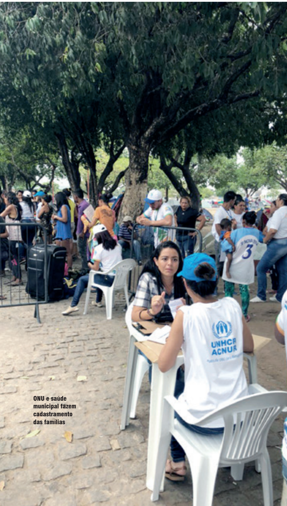
ONU e saúde municipal fazem cadastramento das famílias