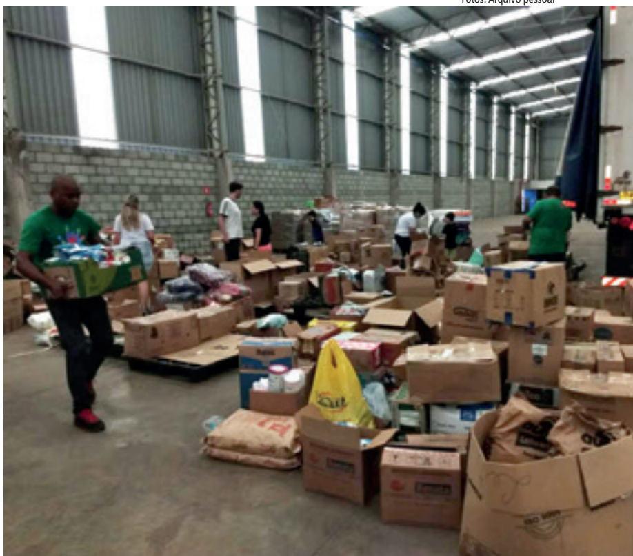
Doações encheram galpão e foram separadas antes do envio a Boa Vista