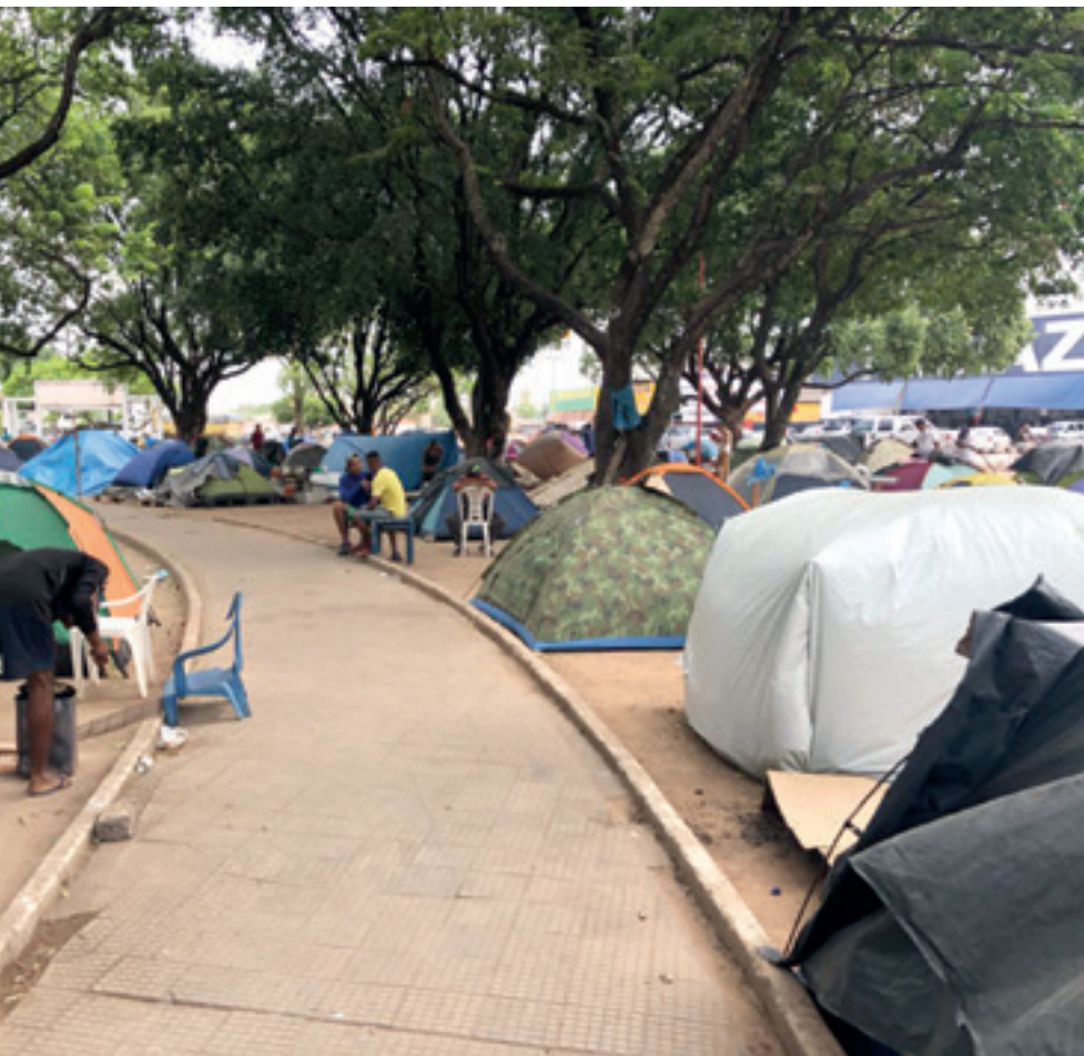
Imigrantes acampam em praça de Boa Vista