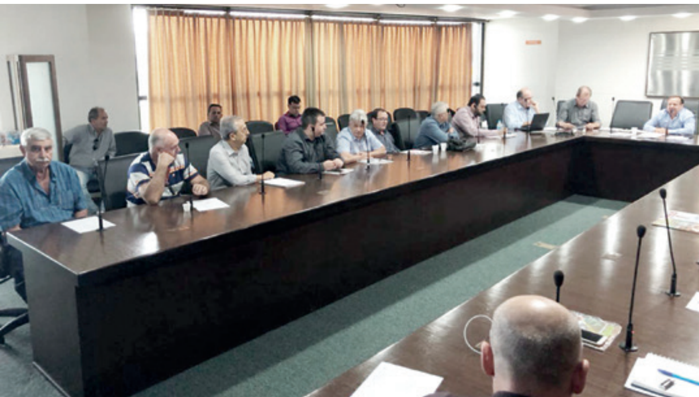
Em assembleia, entidade criou grupo de trabalho