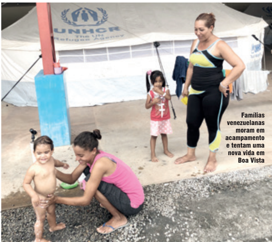
Famílias venezuelanas moram em acampamento e tentam uma nova vida em Boa Vista

Também participaram: Cooperativa de Automóveis e Consumo do Estado de Minas Gerais (Coopercemg); Federação das Empresas de Transportes de Cargas do Estado de Minas Gerais (Fetcemg); Grupo Transportando Ideias; Mercado Verde; Prevenir Proteção Veicular; revista Entrevias ; revista Mais ; Rotary Contagem; Sindicato das Empresas de Transportes de Cargas do Estado de Minas Gerais (Setcemg); Sindicato das Empresas de Transporte de Cargas do Centro-Oeste Mineiro (Setcom-MG); Sindicato dos Transportadores de Combustíveis e Derivados de Petróleo do Estado de Minas Gerais (Sindtanque); Sindicato dos Cegonheiros de Minas Gerais (Sintrauto-MG); Tegma Transportes e Transportadora Damião. 📍