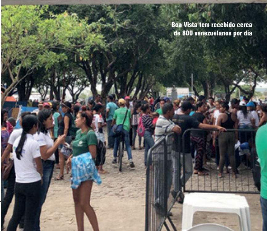
Boa Vista tem recebido cerca de 800 venezuelanos por dia