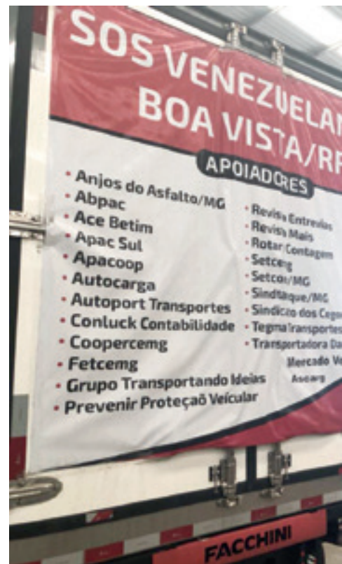
Equipe voluntária descarrega o caminhão de doações em São Carlos (SP). Mantimentos se juntaram a outros para seguir em direção a Boa Vista.