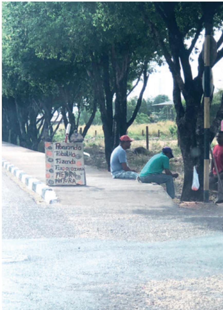
É comum ver pelas ruas e estradas da capital venezuelanos pedindo emprego

O presidente Nicolás Maduro transformou a Venezuela numa ditadura, na qual adversários políticos são perseguidos, presos, torturados e mortos, e as eleições, fraudadas. Ao mesmo tempo, o país vive uma recessão marcada pela escassez de produtos básicos e