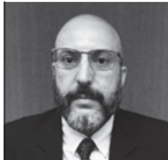
Por Geraldo Eugênio de Assis

Alguns fizeram campanha entre os associados, outros emprestaram carretas, e muitos saíram de suas casas para carregar todo o material arrecadado e enviar para Roraima. Especialistas indicam que manter bons relacionamentos e ajudar o próximo são pontos fundamentais para conquistar a felicidade plena. Pelo visto, os trabalhadores do TRC e das entidades que ajudaram estão no caminho certo. A Entrevias acompanhou de perto toda essa união pela solidariedade. ➔