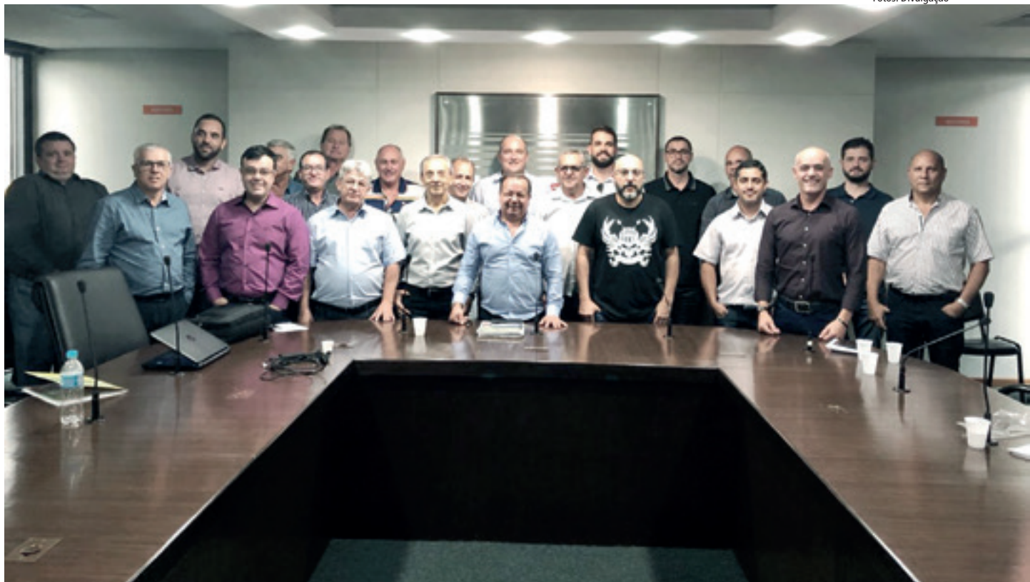
Representantes discutiram marco regulatório do transporte e outros temas