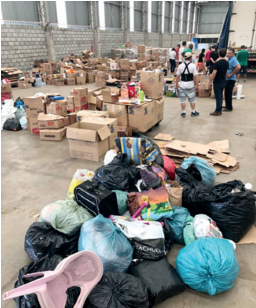
Triagem de doações foi realizada antes de itens serem enviados a Boa Vista